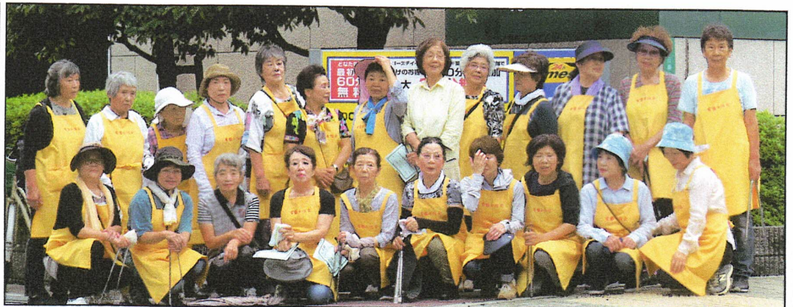
常盤女性会では概ね、あびこ筋西会館から文の里交差点ロイヤルホスト前までの常盤連合に位置する東西歩道での清掃・・・気持ちのいい街・・・ありがとう・・・

常盤女性会では毎月1日、あびこ筋清掃を行っています。この清掃は阿倍野区の女性会が各々の地域で一斉に取り組み街の美化に努めています。ご苦労さま・・・