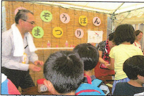
子ども達・・・人気の射撃、当てればok

8月23日(金)ハルカス下の地蔵盆まつり、毎年恒例の子ども達へのまつり・・・子ども達に思いっきり遊んでもらいたい、ゲーム・かき氷・ラムネ・おめん被ってお菓子食べて、射的に手作りゲームも、夕方5時からのおひと時、今年も夕方わか雨あり、近鉄さんにも手伝ってもらい無事終了。