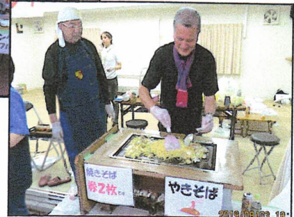
焼きそばやけたよ 美味しいよ!! →踊り上手の皆さん

8月23日(金)ハルカス下の地蔵盆まつり、毎年恒例の子ども達へのまつり・・・子ども達に思いっきり遊んでもらいたい、ゲーム・かき氷・ラムネ・おめん被ってお菓子食べて、射的に手作りゲームも、夕方5時からのおひと時、今年も夕方わか雨あり、近鉄さんにも手伝ってもらい無事終了。