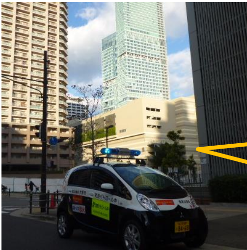
アナウンスをしながら青パトで巡回

地域みまもり隊では、青色防犯パトロールカーや自転車での巡回中に「新型コロナウイルス感染拡大防止へのお願い」と「新型コロナウイルスに便乗した特殊詐欺への注意喚起」のアナウンスを実施しています。